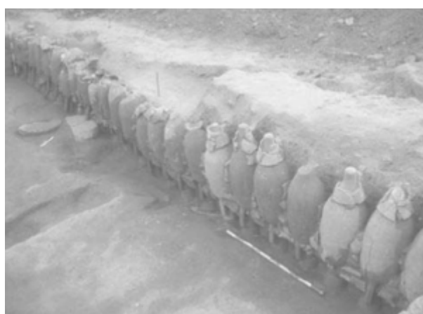
Fig. 3 Vista de la alineación de ánforas Pascual 1 que delimita uno de los muros laterales del área de servicio de los hornos