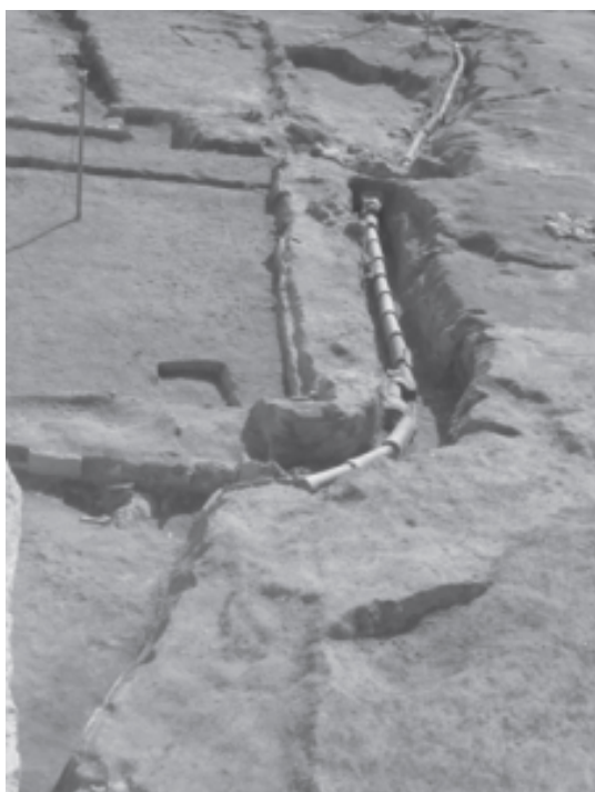
Fig. 2 Vista en detalle de las balsas de decantación de arcillas y sus canalizaciones (extraído de Antequera Devesa y Vázquez Álvarez 2010: 20, fig.7)