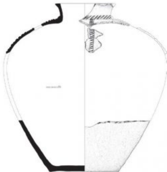
Figura 10. Recipiente de tradición indígena (Villar 2014: 231)