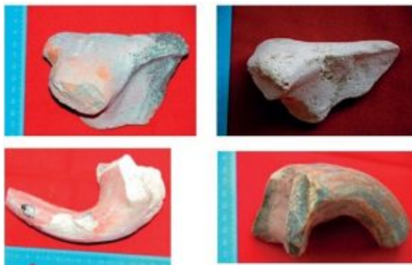
Figura 7. Fragmentos de ánfora tipo Almagro 50 -Lusitania 5/6?. (Villar 2014: 226).