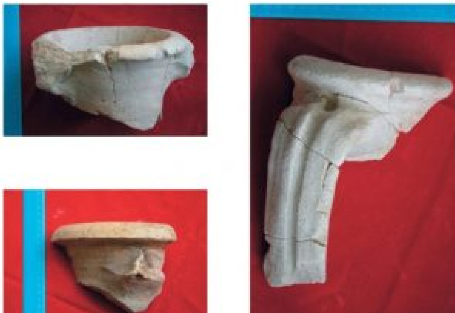
Figura 6. Ánforas Dressel 14 lusitania occidental (Villar 2014: 225).