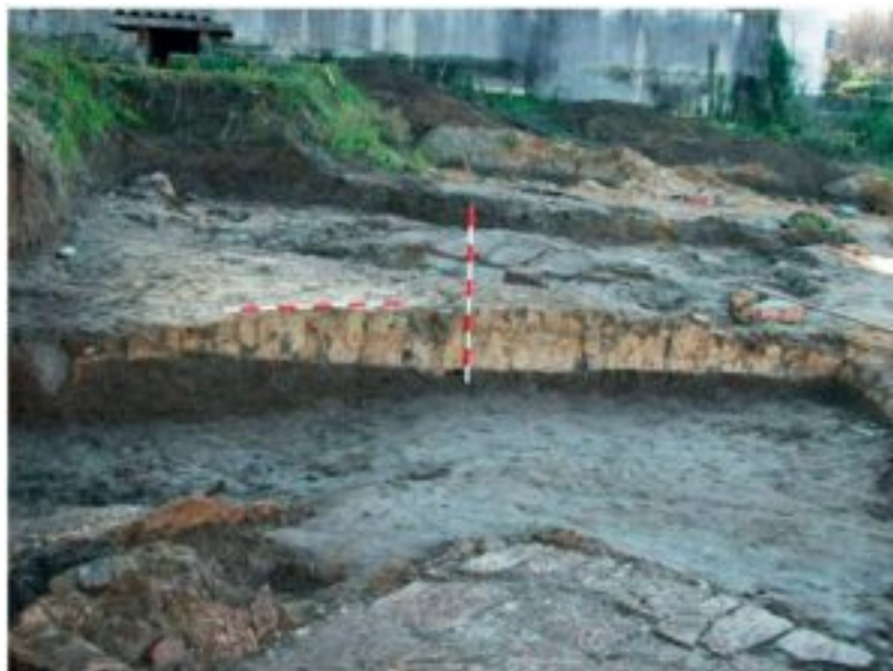
Figura 3. Acopio de arcilla (Villar 2014: 219)