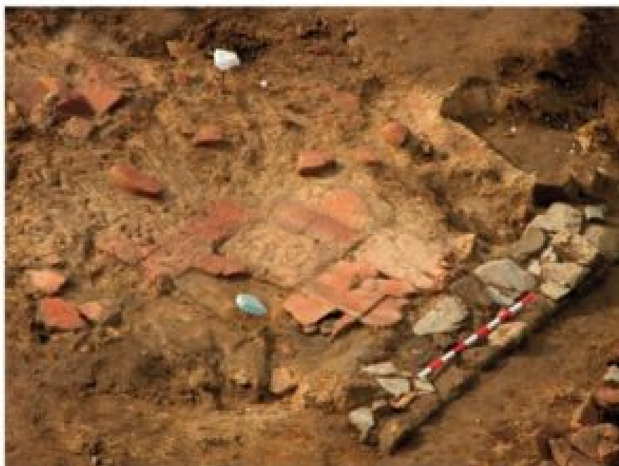
Figura 4. Pavimento (Villar 2014: 219)

Tipo de espacio: Áreas de trabajo anexas