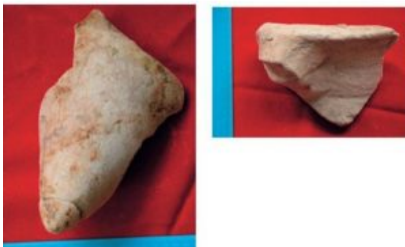
Figura 8. Fondo cónico y boca de ánforas Almagro51C lusitana occidental 4 (Villar 204: 226)