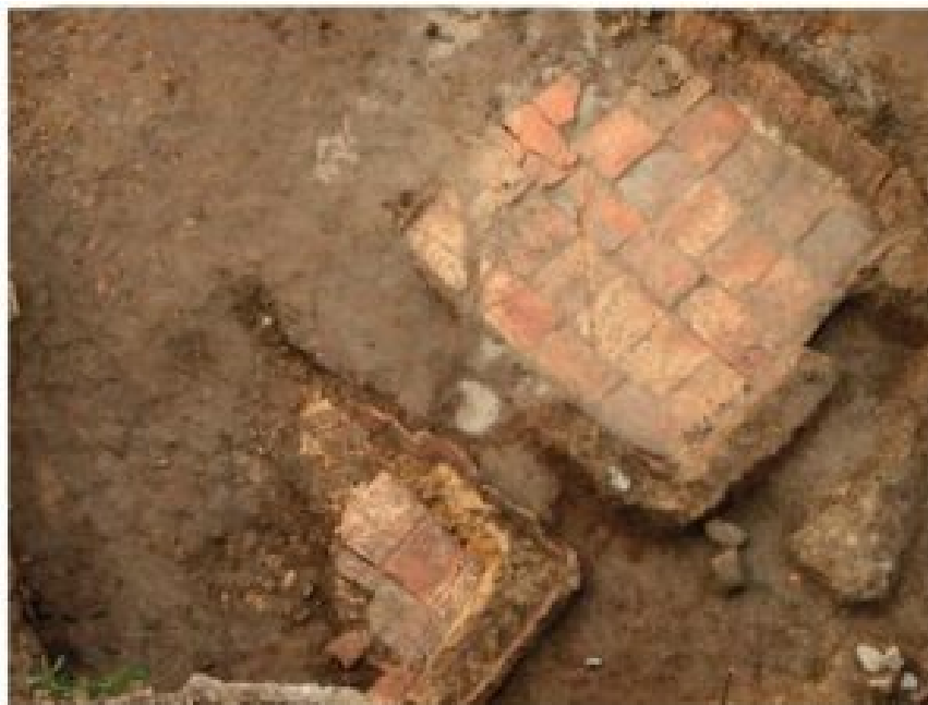
Figura 2. Piletas de decantación o amasado (Villar 2014: 219)

Tipo de espacio: Fosas o estructuras de almacenamiento de arcillas o desgrasantes