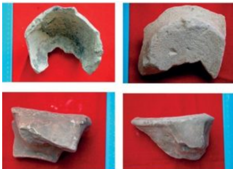
Figura 9. Fragmentos de ánfora Lusitana 9 (Villar 2014: 227).