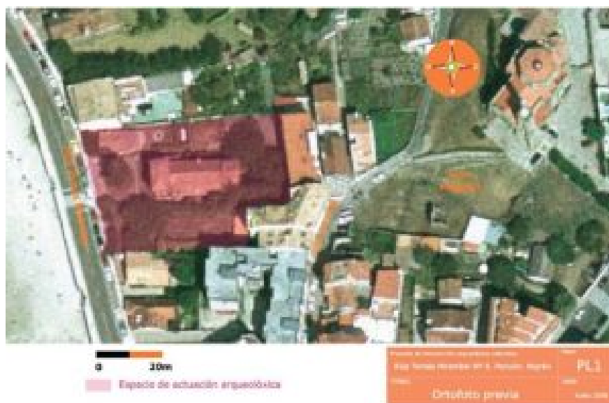
Figura 1. Localización del solar Rúa Tomás Mirambel nº8 (Villar, 2014: 216).

Los restos identificados permiten comprender la organización del alfar. De este modo, un muro pétreo serviría como eje de distribución. Al norte de este se localizaría el patio de trabajo de la arcilla, donde se localizarían diversos puntos de acopio de materia prima (se conocen barras de arcilla en el litoral de Monteferro, próximas al yacimiento, así como otras en ayuntamiento de Panxón). En esta área también se localizarían las pilas de amasado y, posiblemente, en este patio, se almacenasen trozos de piezas rotas durante el proceso de fabricación (según la cantidad de fragmentos de ánfora recuperados). Al sur del muro se documenta un pavimento rústico que funcionaría como espacio de secado de las piezas al sol, antes de su cocción en el horno. Así mismo, en este espacio se documentó un área de destrucción, donde podría existir una techumbre, correspondiente con el espacio doméstico del alfar (y donde se recuperaron fragmentos de cerámicas domésticas). Más al sur, se identificó un espacio relacionado con los centros de calor que podría formar parte del infierno de un horno. Así mismo, estos también podrían corresponder a la zona doméstica de los trabajadores del alfar, segundo la dirección de un canal de aguas interpretado como estructura para la evacuación de aguas de la parte doméstica (Villar 2009: 74,75; Villar 2014: 234-235).