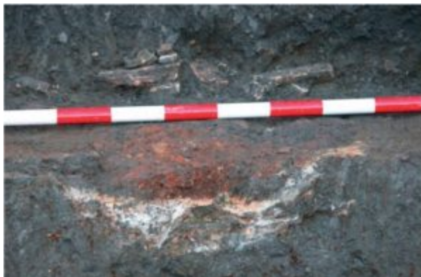
Figura 5. Centros de calor (Villar 2014: 219)