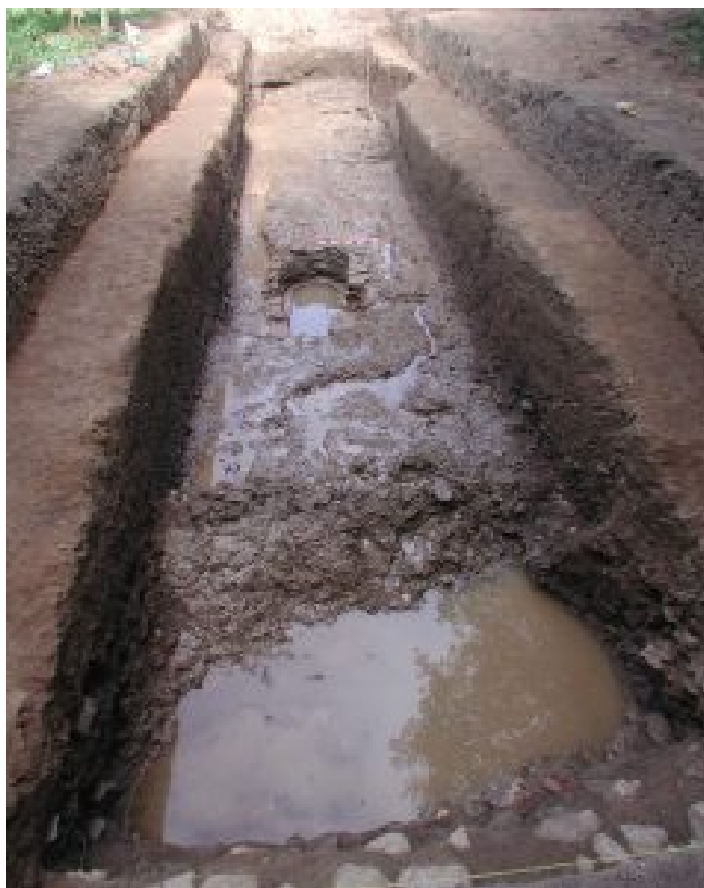
Figura 3. Localización del horno romano en el sondeo 4.