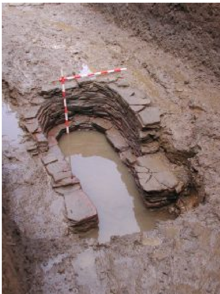
Figura 4. Horno de Baixada do Carme localizado en el sondeo 4 (Imagen de Enrique González Fernández 2008).