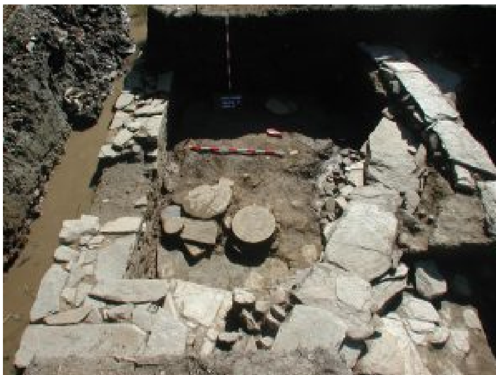
Figura 2. Edificación documentada en el sector 12, en cuyo interior se observa la presencia de discos vinculados a los trabajos del alfar.