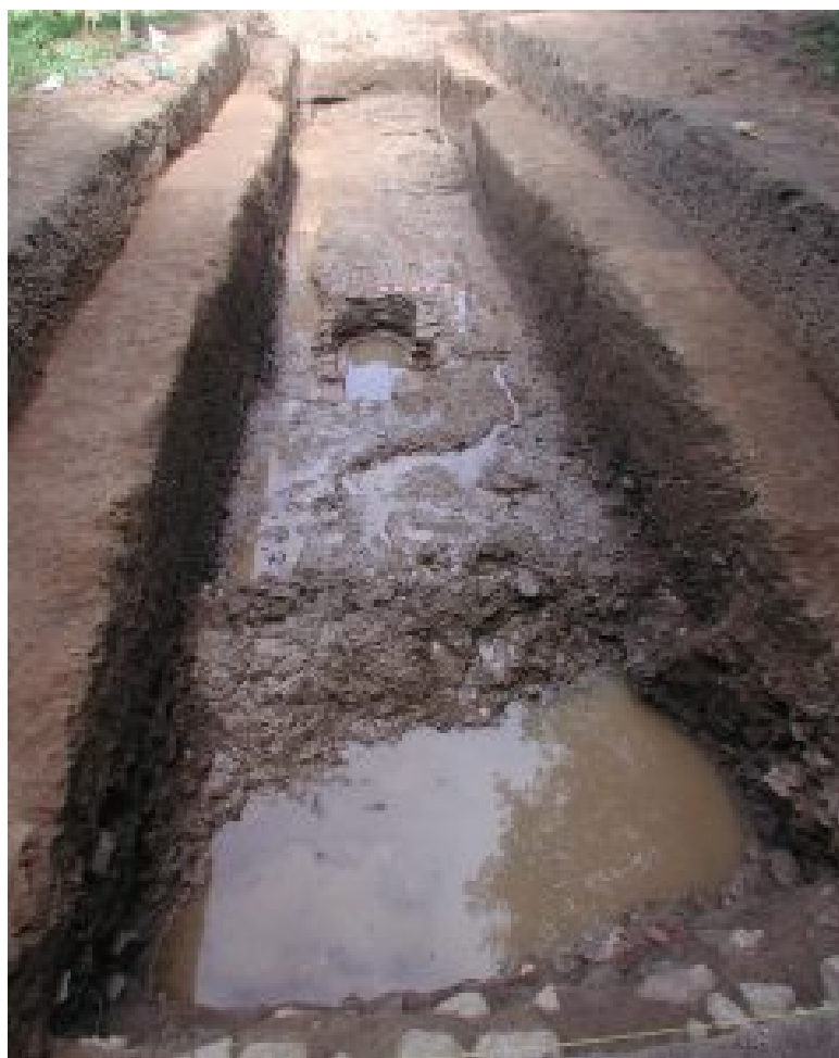
Figura 3. Localización del horno romano en el sondeo 4.