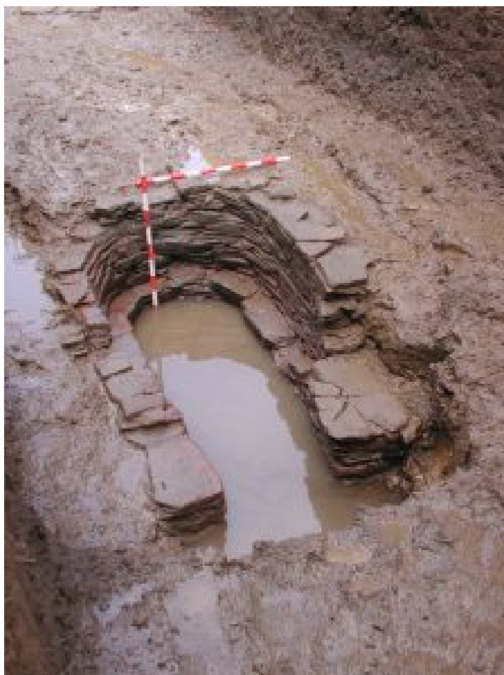
Figura 4. Horno de Baixada do Carme localizado en el sondeo 4.