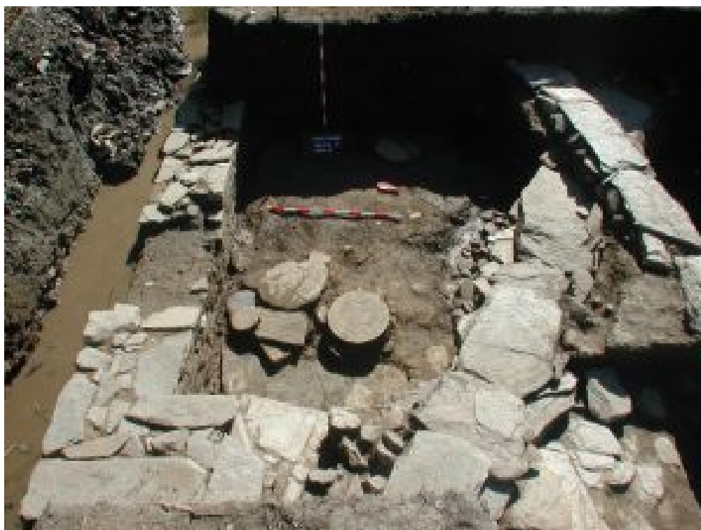
Figura 2. Edificación documentada en el sector 12, en cuyo interior se observa la presencia de discos vinculados a los trabajos del alfar.