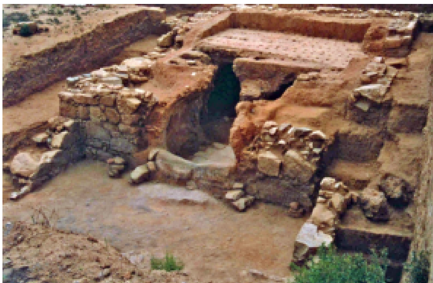
Fig. 1 Vista del Horno I.

El Horno II es una estructura de planta circular, de aproximadamente 3 m de diámetro con el praefurnium apuntando hacia la riera de Cabrera. Si bien, aunque excavado de forma parcial, no ha ofrecido restos cerámicos en su interior que nos permitan conocer su producción, hay que relacionarlo con el área industrial de época tardo-republicana.