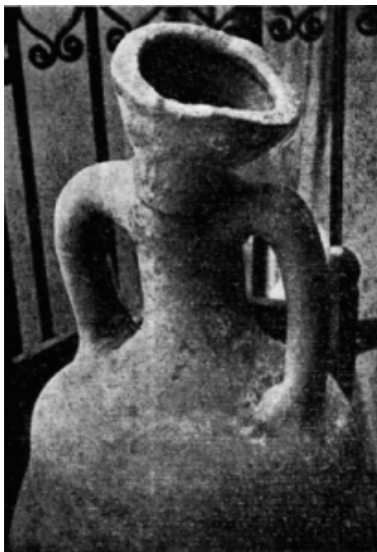
Fig. 1 Ánfora de tipología Pascual 1 con evidentes defectos de cocción. Hallada en 1957 en unas obras en la Calle Balmes (Montes y Sala 1962: 289, fig. 31).