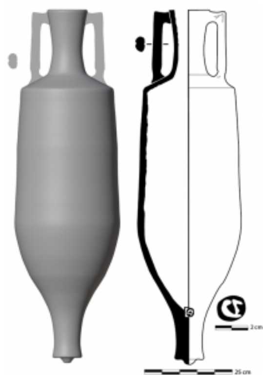
Fig. 5 Restitución tridimensional, realizada por Enric Colom Mendoza de un ejemplar de Dressel 2 con marca CE o CF in pede del Segundo Muro de Ánforas de Cartago. Dibujo cortesía de J. Freed (Colom Mendoza 2021: 395, fig.272).