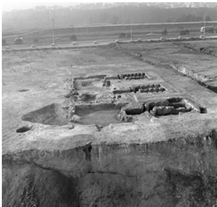
Fig. 3 Vista de los hornos cerámicos de Can Feu (extraído de Comas y Carreras 2008: 180, fig.2).