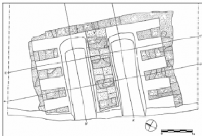
Fig. 1 Vista y planimetría del horno de Can Notxa (Rigo 1996: anexo de planos y diapositivas).