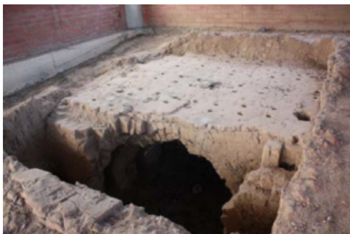
Fig. 1 Vista del Horno II de Can Ventura de l'Oller (extraído de Oller 2012: 449, fig.94).