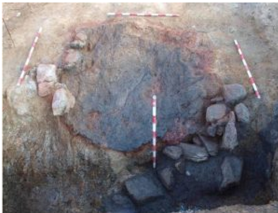
Figura 1. Planta del horno desde el Sur tras su excavación (César 2011).

partir de la excavación, no se identificaron materiales que permitan concretar la producción de las piezas del horno, así mismo, tampoco se documentaron otras evidencias referentes a estructuras o dependencias pertenecientes a un taller o complejo alfarero.