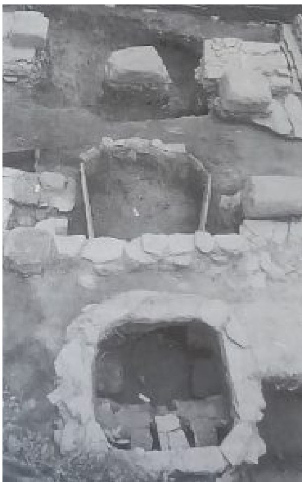
Figura 2. Horno localizado en la intervención del 2000 en Carril dos Loureiros nº 30 (AA.VV 1997: 211).