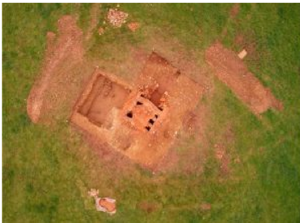
Figura. 2. Imagen aérea del yacimiento de Chouza da Ponte (Bartolomé 2018).

La localización de este taller debe de entenderse en relación con los recursos naturales que ofrece el entorno. Así pues, la proximidad al río se relaciona con el abastecimiento de agua; la existencia de un bosque de ribera proporcionaría el aprovisionamiento de leña. Por otra parte, la presencia de un espacio llano permitiría extender las piezas para secar; la orientación contribuiría, mediante una fuerte insolación, al secado de los materiales y la proximidad de depósitos de arcilla daría acceso al abastecimiento de esta materia prima (aunque estas no se han identificado) (Díaz 1999: 54-55).