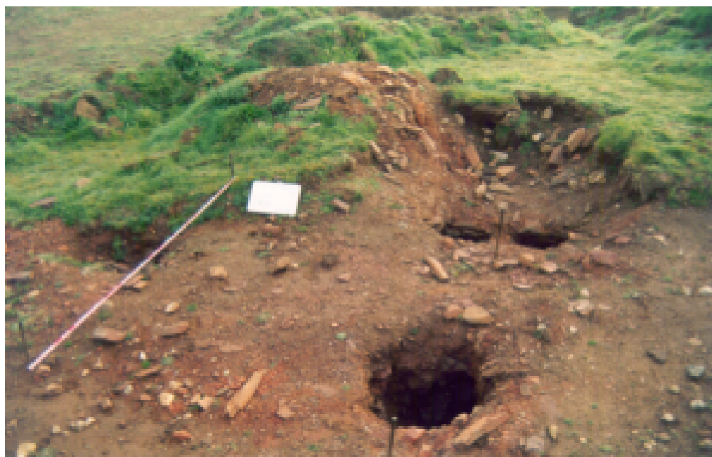
Figura. 1. Estado del horno en 1998 (Díaz 1999).

Ante la relevancia del hallazgo se llevó a cabo una intervención arqueológica en 1998 dirigida por Fructuoso Díaz García. Se planteó la realización de un sondeo con el fin de documentar el praefurnium y el grado de alteración que los trabajos de minería pudiesen haber causado. Así mismo, en el resto del yacimiento se llevó a cabo una excavación con el fin de identificar otras estructuras y niveles asociados al horno (Díaz 1999: 4, 12).