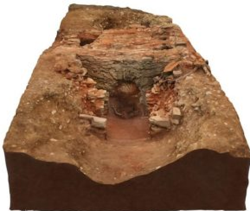
Figura. 5. Renderizado del horno de Chouza da Fonte (a partir del levantamiento fotogramétrico de la estructura) tras la intervención de 2018 (Bartolomé 2018).