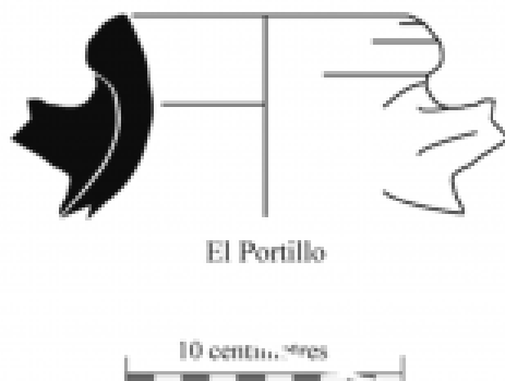
Fig. 2. Ánfora Dressel 23 A de El Portillo (de O. Bourgeon, 2017, 526, Fig. 4, modificado).