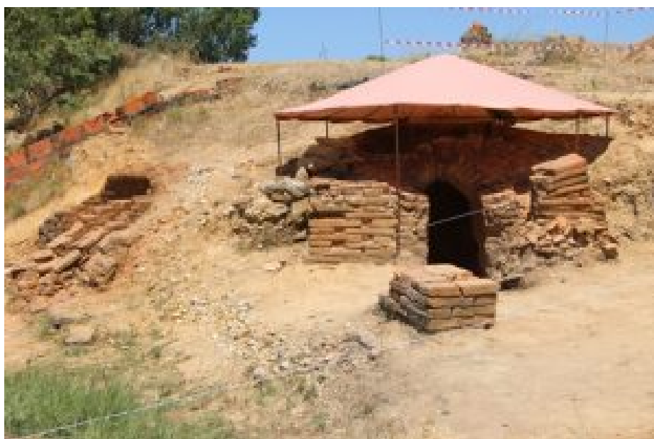
Fig. 1 Forno dois com cobertura de proteção e o forno 1 na base do talude e polar de cobertura fronteiro ao forno 2.

No mesmo período, irá decorrer um ensaio na Garrocheira com um drone, em fase de ensaios por uma instituição universitária, a fim realizar no local testes de deteção magnética de anomalias no terreno, no caso presente, da eventual existência de novos fornos e outras estruturas associadas à produção oleira.