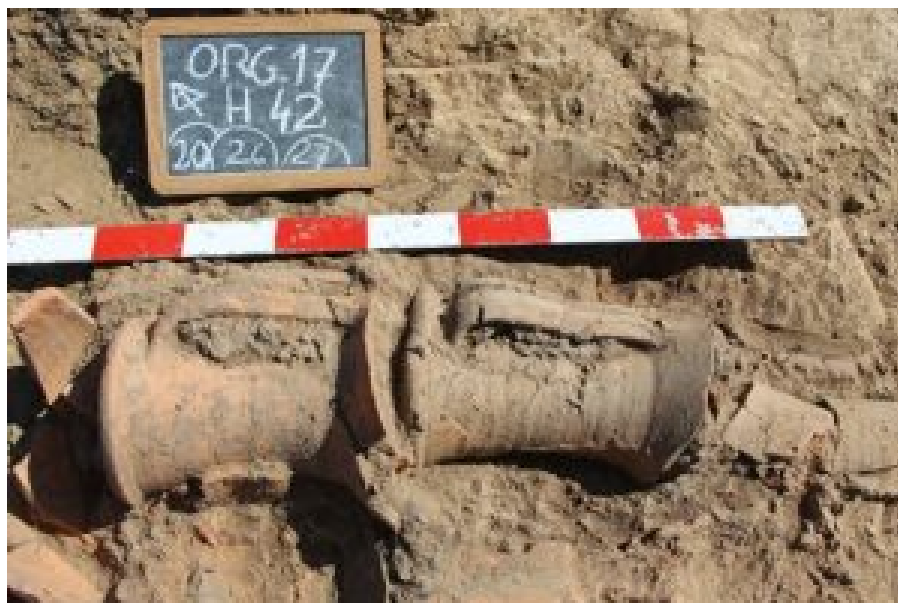
Fig. 4 Entulheira 1- alinhamento de bocas de ânfora Dressel 14

uma estrutura algo complexa. Poderá tratar-se de sistema de drenagem, embora a sua função não seja clara, faltando ainda conhecer o seu eventual desenvolvimento para nascente.