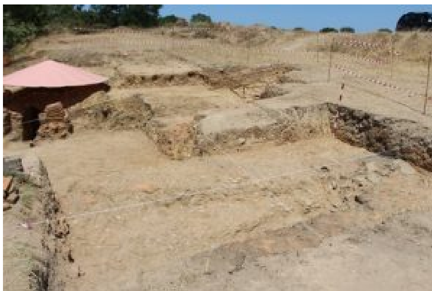
Fig. 5 Entulheira 1 à direita do forno 2 e em primeiro plano a entulheira 2.