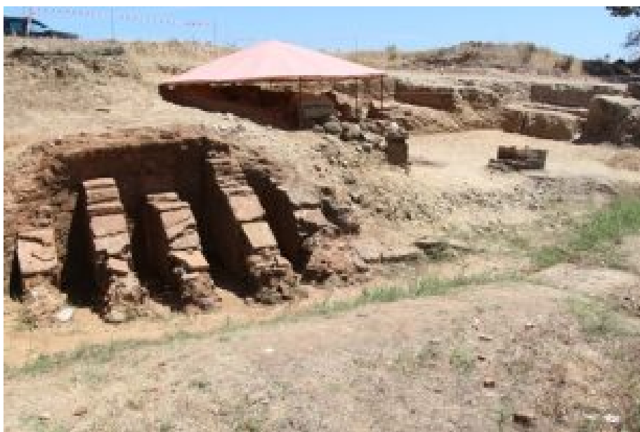
Fig. 2 Forno 1, em primeiro plano, forno 2 e ao fundo, canto superior direito, a área da entulheira 2.