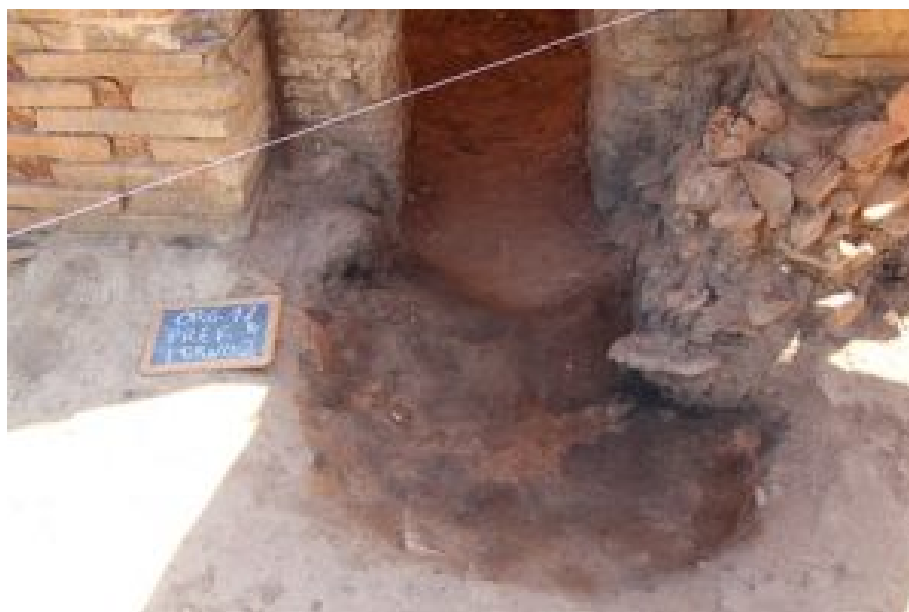
Fig. 3 Prefurnium do forno 2, aberto no solo de base, com marcas de combustão.