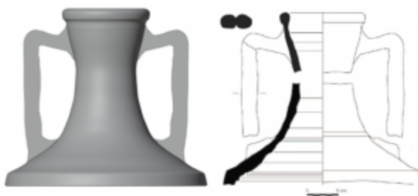
Fig. 3 Restitución tridimensional propuesta para los tercios superiores de los tipos Dressel 3 y Pascual 1 (a partir de Coll Monteagudo et al. 2016: 127, fig.4, 132, fig.8 (Colom Mendoza 2021: 818, fig. 584)).

Llegados a este punto, puede decirse que ya se ha conseguido el tipo clásico de la Dressel 3 , como se constata en una cierta cantidad de ejemplares. Puede observarse que la mayoría de los bordes presentan unos 12 cm de diámetro, aunque encontramos algunos de 10-11 cm, como sucede en el centro productor del Roser/Mujal de Calella. Los labios de las ánforas de la Gran Via - Can Ferrerons, si los comparamos con los ejemplares más evolucionados de la Dr. 2-3, están muy poco desarrollados y son relativamente variables, como si formalmente no estuviese aún bien asentada su tipología. A pesar de que la mayoría de ellos tienden al bastoncillo semicircular, no faltan los que presentan una sección más o menos triangular, a veces incluso con biselado interno. Vemos también bastoncillos que tienden a la sección más o menos cuadrada, e incluso moldurada, e incluso algunos labios presentan una ancha acanaladura horizontal, y en un caso esta acanaladura se encuentra peinada o cepillada (fig. 6).