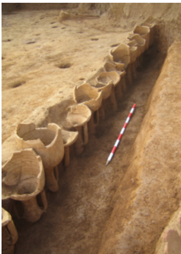
Fig. 1 Alineación de ánforas Pascual 1 documentada en el alfar de Gran Via- Can Ferrerons (extraído de Col Monteagudo et al. 2016: 202, fig. 4).

Las estructuras detectadas corresponden a un edificio rústico perteneciente a un cercano alfar, del cual se ha descubierto el ángulo en L de un recinto porticado con patio central, en un espacio de unos 914 m 2 . El ala noroeste del edificio parece haber sido ocupada por una batería de habitaciones, mientras que el ala nordeste sería un porticado, del cual se hallaron los basamentos pertenecientes a cinco pilares, separados a distancias regulares de 10 pies (2,95 m). En el exterior también fueron localizadas diversas estructuras constructivas (fig. 1).