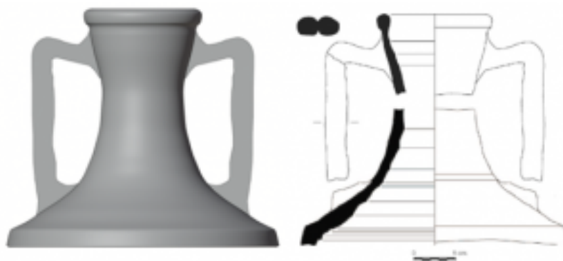
Fig. 3 Restitución tridimensional propuesta para los tercios superiores de los tipos Dressel 3 y Pascual 1 (a partir de Coll Monteagudo et al. 2016: 127, fig.4, 132, fig.8 (Colom Mendoza 2021: 818, fig. 584).

Las formas locales de Dressel 3 muestran unas bocas de un diámetro que oscila entre los 10-12 cm, bordes muy poco desarrollados y de escasa altura, con tendencia a la sección redondeada, si bien también encontramos secciones ligeramente triangulares e incluso cuadrangulares. Las asas son relativamente cortas, paralelas y muy separadas del cuello, con un marcado codo sobreelevado, a veces rematado en una arista viva, y sección bífida. Los cuellos son cortos, anchos y robustos, en algunos casos con un perfil más cilíndrico y en otros más cóncavo, con el punto de diámetro mínimo a media altura del mismo. Los hombros están bien marcados, con campanas relativamente poco altas, formando un ángulo de unos 100º, aproximadamente.