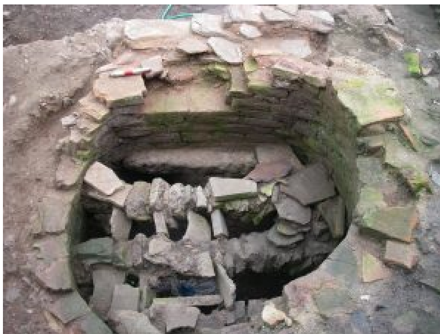
Figura 2. Horno cerámico de la intervención en la U.I. 7-C (Hervas 2008).