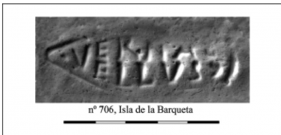
Fig. 3. Sello VERNAC/ELLVS (hedera) de La Barqueta (Berni y Moros, 2012, 201, Fig. 8).