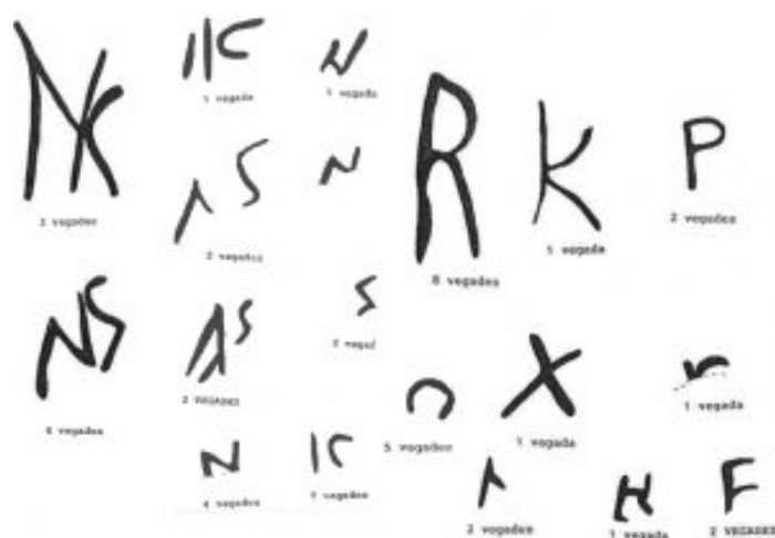
Fig. 3 Grafitos in pede documentados en La Clota (Vilaseca Canals 1994: 9).

No se documentan sellos, aunque sí aparecen con relativamente frecuencia grafitos ante cocturam en el pivote, con un total de 48 ejemplares (Vilaseca Canals / Carilla Sanz 1999: 363).