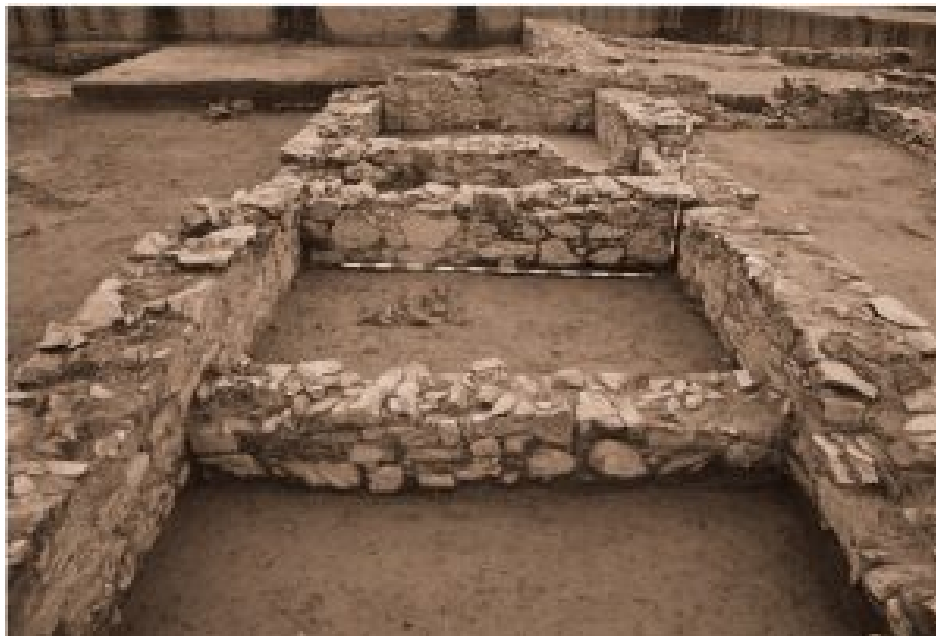
Figura 4. Cubículos de almacenamiento y tratamiento de arcillas (Misiego et al 2013: 340).