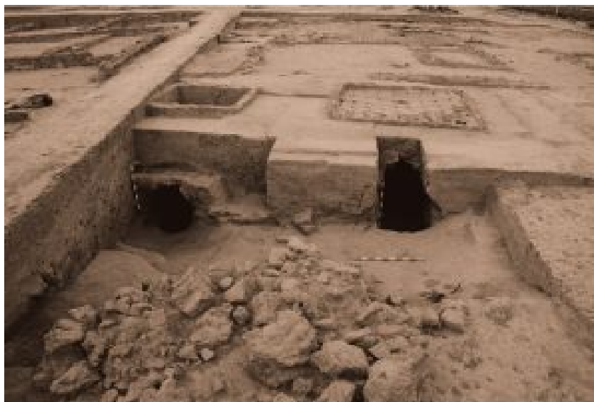
Figura 8. Vista general de los hornos A y B (Misiego et al 2013: 344).