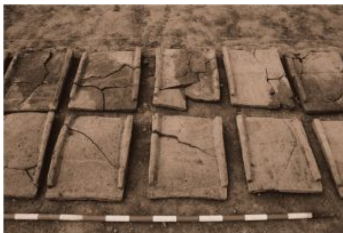
Figura 10. Tégulas (Misiego et al 2013: 359).