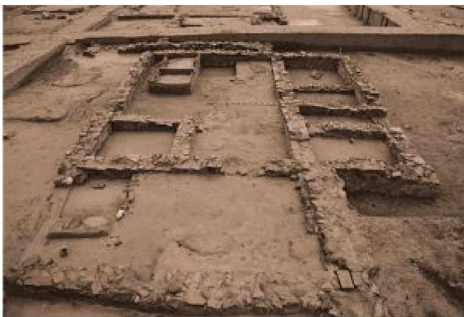
Figura 3. Área de almacenamiento, Edificio 1 (Misiego et al 2013: 339).

El edificio 1, situado en la esquina NO, se correspondería con el área de almacenado de arcillas. Este se construyó en un primer momento de forma exenta e individual, pero posteriormente sufriría remodelaciones. Este edificio presentaba una compartimentación que permite identificar un espacio central (1B) que articularía una serie de habitaciones en el interior, que funcionarían para el almacenamiento de materias primas. Este edificio fue remodelado en la segunda etapa (fase IIIb), conservando la misma funcionalidad, pero haciéndose más complejo mediante la construcción de un nuevo espacio adosado al muro O y la reforma interior que llevó a la desaparición de algunas habitaciones. La compartimentación interna se redujo por espacios de mayores dimensiones, posiblemente en relación con una producción mayor. Posteriormente, en un momento más tardío se adosó una nueva serie de habitaciones a la edificación, dos estancias apoyadas en el muro N, que estarían relacionada con el fuego, aunque no se ha definido correctamente (Misiego y Martín 1998: 393; Misiego et al 2013: 338-343).