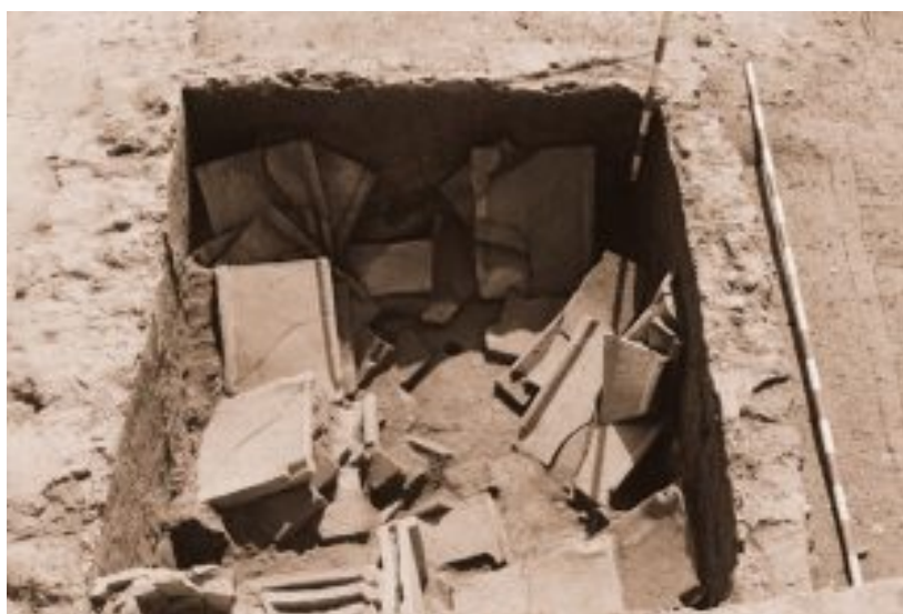
Figura 9. Última carga de tégulas recuperada en el interior del horno A (Misiego et al 2013: 38).

sí por cuatro arcadas de medio punto. Estas galerías tendrían relación con la distribución del aire caliente (Misiego y Martín 1998: 404-405; Misiego et al. 2013: 351-352).