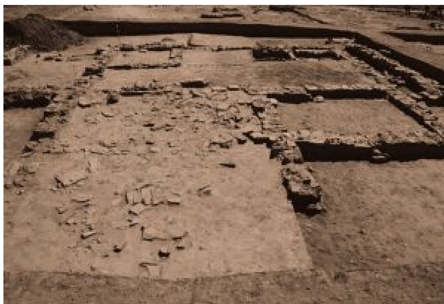
Figura 6. Área de almacenamiento de materiales del alfar (Misiego et al 2013: 341).

En el Edificio 1, junto a las demás dependencias, se identificó una habitación de grandes dimensiones (1F). Su uso puede relacionarse con el almacenamiento de piezas concretas, en este caso de tegularium , motivo por lo que, a diferencia de las funciones atribuidas al edificio, no se encuadraría dentro del proceso técnico. Su ubicación podría estar determinada por su proximidad a una zona de tránsito en las cercanías (calzada o vía) o por la presencia de más espacio libre en esta área. (Misiego y Martín 1998: 397-398; Misiego, Martín, Marcos y Sanz 1997: 37; Misiego et al 2013: 344).