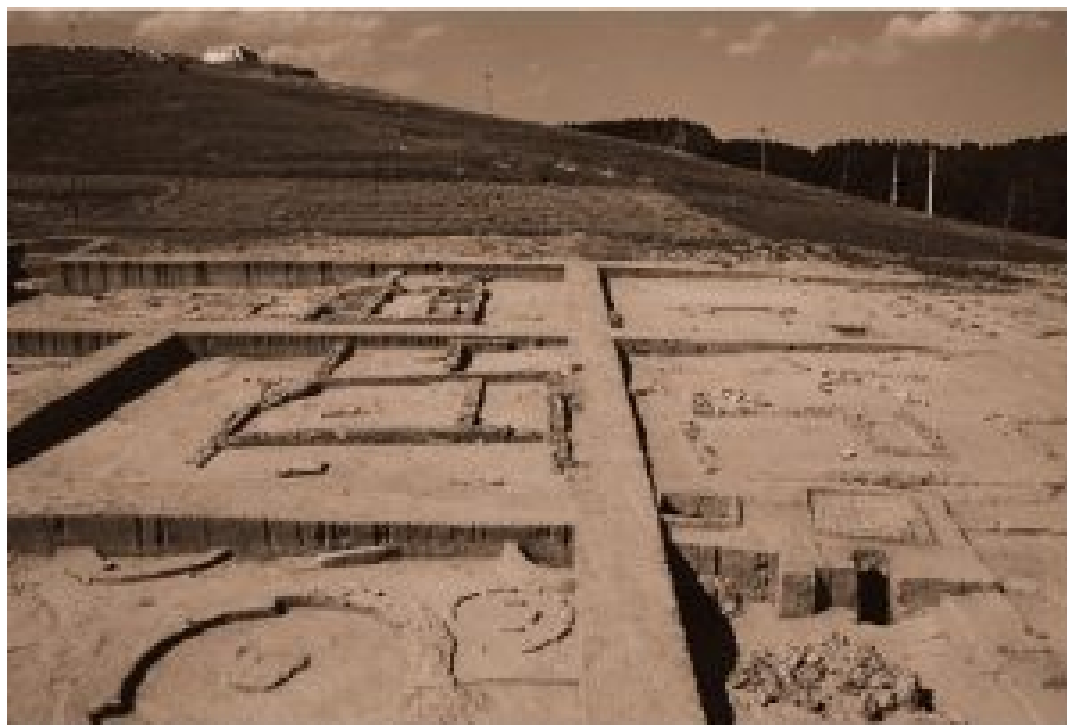
Figura 1. Perspectiva general de la Fase Manganeses III (Misiego et al 2013: 338).

El establecimiento del alfar supuso la ocupación de un espacio previamente ocupado. La elección del emplazamiento se llevó a cabo valorando las características naturales del entorno para el correcto funcionamiento del taller cerámico. Así, se valoraría la presencia de materia prima, la cercanía de fuentes de agua próximas y la abundancia de combustible. De este modo, el acceso a las materias primas era esencial para la producción de materiales cerámicos de arcilla, documentándose barreras a 600 m del taller. El abastecimiento de agua estaría asegurado mediante la cercanía del río Óbrigo a escasos 100 m, así como la proximidad del arroyo de El Pesadero. En cuanto al aprovechamiento de materiales combustibles, el estudio medioambiental, complementado por los análisis antracológicos y palinológicos, permitieron detectar la presencia de las especies que se emplearon como recurso para la combustión de los hornos. Los resultados indican que la proliferación del taxón Ericaceae (brezos) permitiría su aprovechamiento como fuente permanente de leña, junto con la madera de aliso (Misiego y Martín 1998: 391-392; Misiego et al. 2013: 334-336).