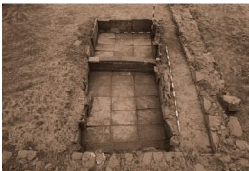
Figura 2. Piletas de decantación de arcillas (Misiego et al 2013: 339).

pudo haber funcionado como estructura para la contención de líquidos y, posiblemente, para la decantación de arcillas en la fase IIIb. No se documentaron otras evidencias del proceso de decantación, puesto que la remodelación del alfar (de la fase IIIb) pudo llevar a la destrucción de los elementos o, su situación pudo haberse localizado junto al barrero (338). Se trata de una pileta de 340×135 cm, elaborada a base de tégulas y ladrillos; el perímetro fue enmarcado por una alineación de tégulas dispuestas en vertical. Al tiempo, este espacio fue dividido por un murete de ladrillos dispuestos a tizón, resultando un ámbito de 145×135 cm al N y otro de 180×135 cm al S. Su funcionamiento, se constata con la documentación en las inmediaciones de un potente estrato de arcillas y grava que parece corresponder con los sedimentos resultantes de la decantación (Misiego y Martín 1998: 396-397; Misiego, Martín, Marcos y Sanz 1997: 37; Misiego et al 2013: 338-343).