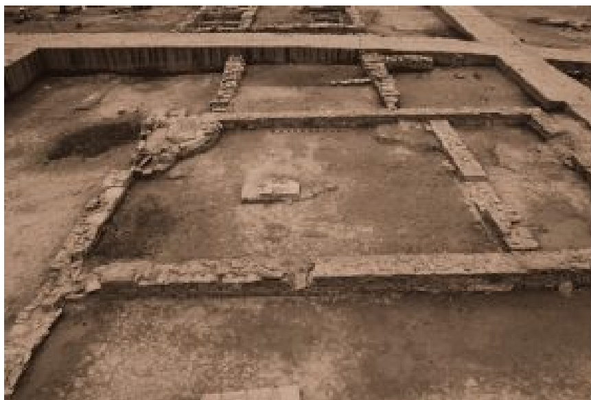
Figura 5. Área de torneado o modelado (Misiego et al 2013: 343).

que modelar piezas). El último espacio se correspondería con un área externa, una estructura a modo de porche (Misiego, Martín, Marcos y Sanz 1997: 36; Misiego 1998: 398-399; Misiego et al 2013: 344-345).