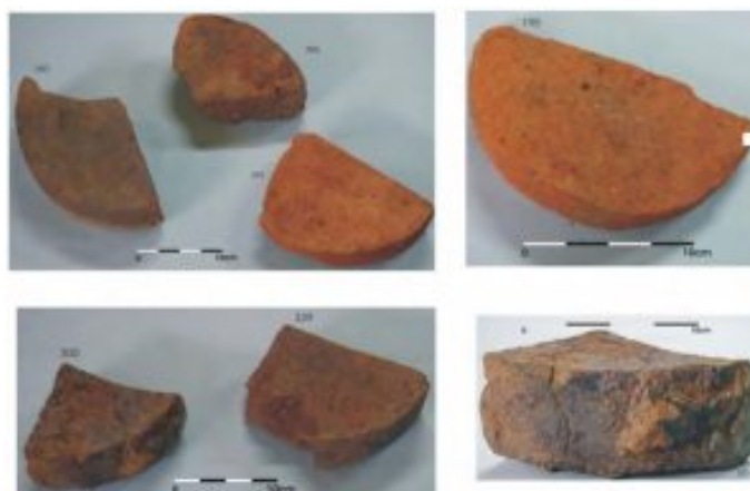
Figura 5. Ladrillos circulares de La Teyera (Requejo 2014)

No se ha documentado ninguna pieza completa aunque se ha documentado una pieza circular con un diámetro de 16,4 cm y 4,9 cm de grosor; dos semicirculares con radios de 11,5 y 15 cm, con grosor de 7,7 cm y 5,7 cm; tres de segmento de círculo con radios de 12,5 cm y 16,3 cm, con grosor de 8 y 6,5 cm (Requejo 2014).