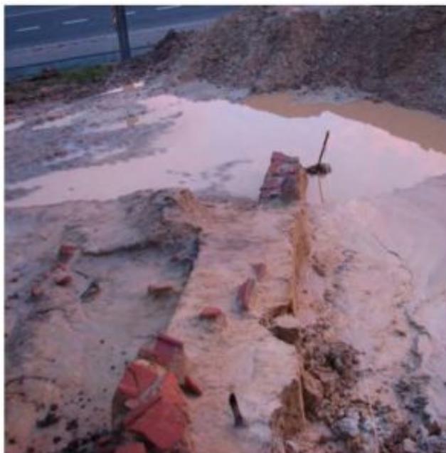
Figura 2. Drenaje Horno 2 (Requejo 2014)