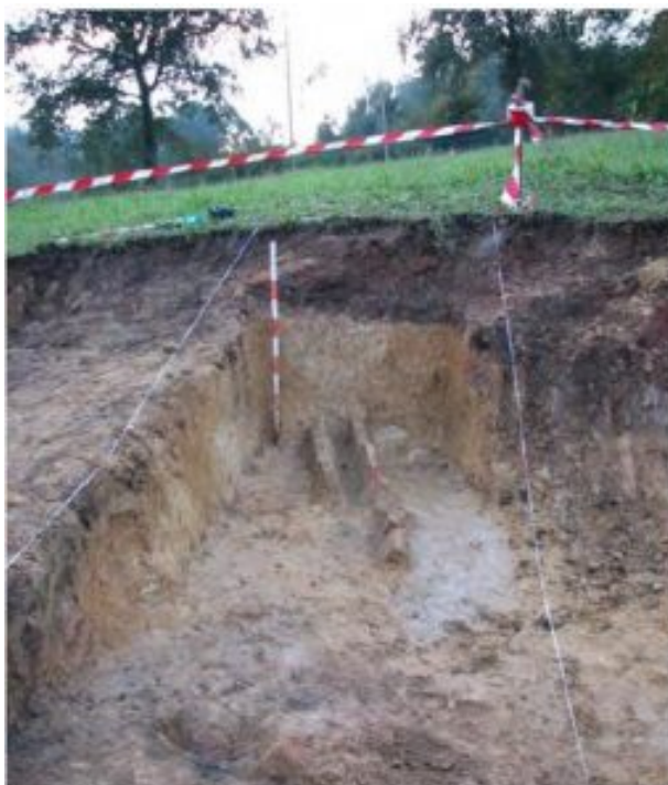
Figura 1. Drenaje Horno 1 (Requejo 2014)