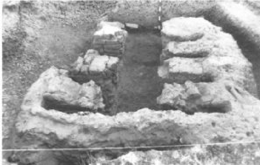
Figura 1. Estructura del horno tras su excavación (Carballo y Viñé 1990b).