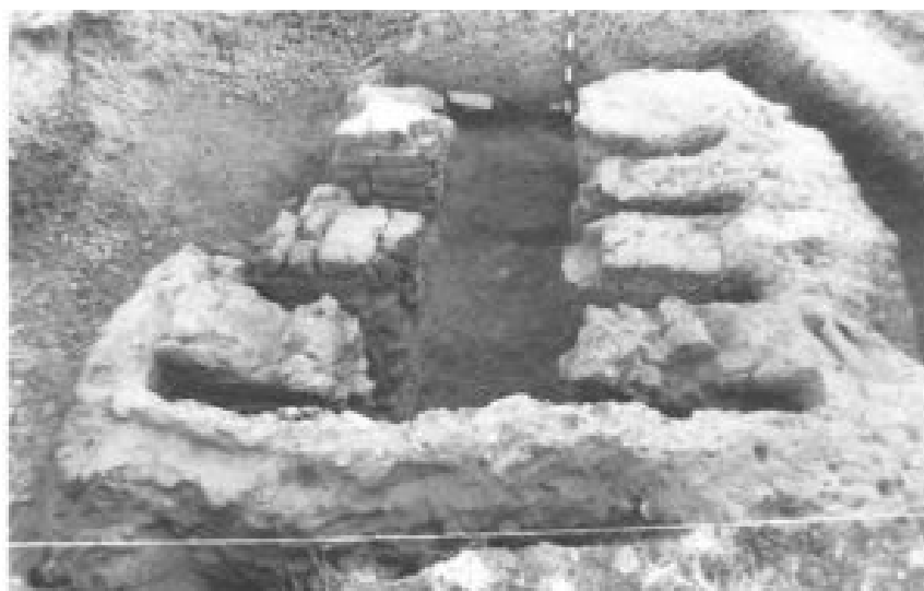
Figura 1. Estructura del horno tras su excavación (Carballo y Viñé 1990b).