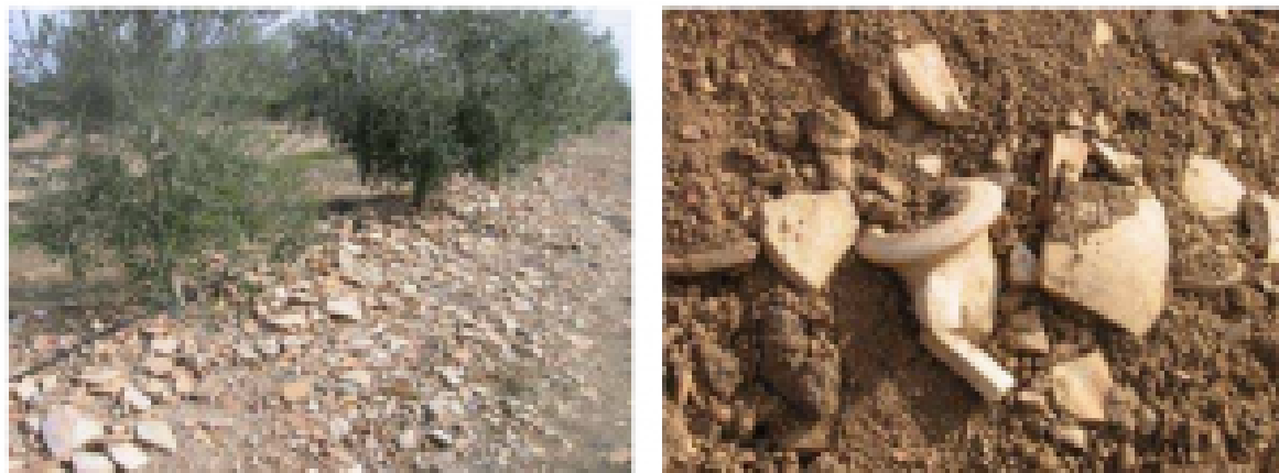
Fig. 3. Restos cerámicos en superficie y detalle de fragmentos de Dressel 20 en la “zona 2” prospectada en 2005 (Toboso y Pineda, 2010, 569, láms. IV y V).

En marzo de 2014 O. Bourgeon volvió a prospectar la finca de Malpica, en el marco de su investigación doctoral y del proyecto OLEASTRO, proporcionando una delimitación precisa del yacimiento, así como de sus áreas de dispersión y de concentración de restos cerámicos en superficie. Recuperó fragmentos de ánforas Dressel 20 y Dressel 23, así como lebrillos/soportes y numerosos sellos (Bourgeon, 2022, 305-314).