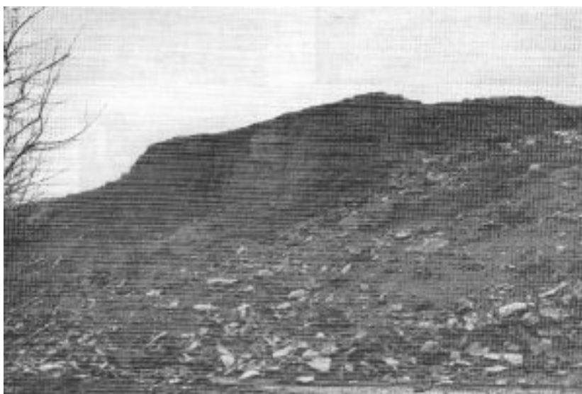
Fig. 1. Restos de ánforas en el sitio de Malpica 1 (de Ponsich, 1979, 130, Pl. XLV).

G.Chic García visitó la finca de Malpica en 1975, y pudo observar en superficie “restos de muros construidos con tiestos”, un horno de planta circular, muy destruido, así como numerosas asas de ánforas con marcas (Chic, 1985, 44).