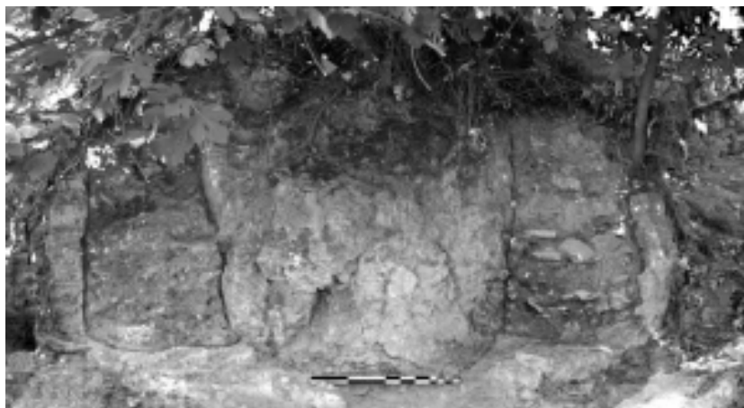
Fig. 1. Horno con pilar central de Malpica 2 (de O. Bourgeon, 2016, 342, Fig. 7)