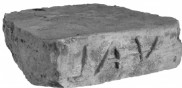
Fig. 4. Ladrillo con sello descubierto en el relleno del Horno 1 (de O. Bourgeon, 2016,343, fig. 8).