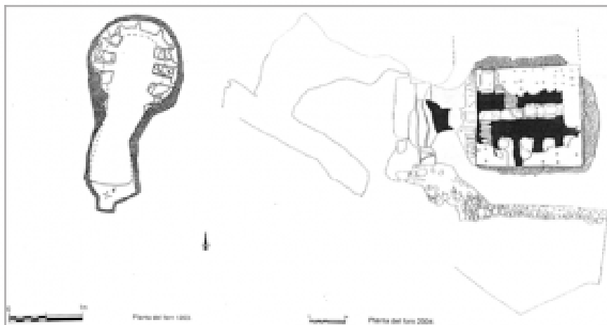
Fig. 1 Planta de dos de los hornos excavados en Mas Manolo (extraído de Tauleria 2019: 62, fig.28).