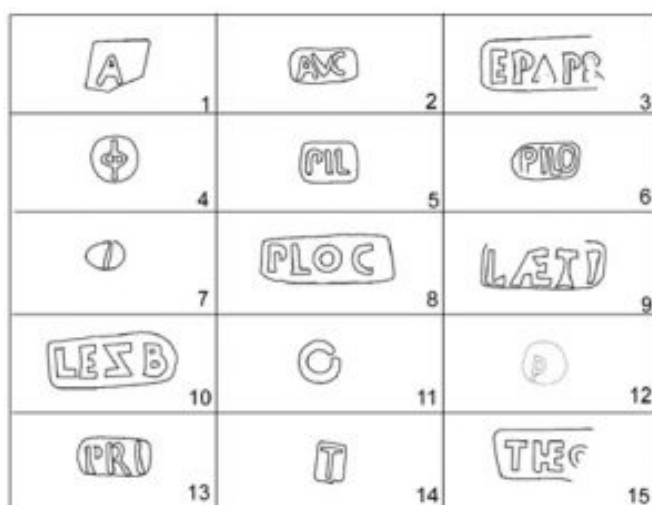
Fig. 2 Marcas epigráficas documentadas en el Mercat de Santa Caterina (Aguelo et alii 2006:71, fig. 6).