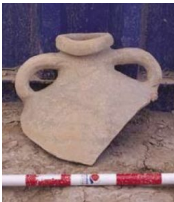
Fig. 9 Oliva 3 de producción local (Casabán Banaclocha et alii 2013: 72, fig.9.3).

En las publicaciones consultadas no aparecen dibujos arqueológicos del material, si bien por las fotografías mostradas, parecen seguir, en líneas generales, las características morfológicas de las producciones del Ager de Dianium , como las de l'Almadrava.