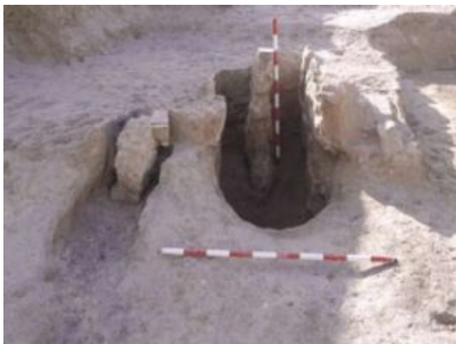
Fig. 7 Hornos VIII y IX (Casabán Banaclocha et alii 2013: 70, fig.7).