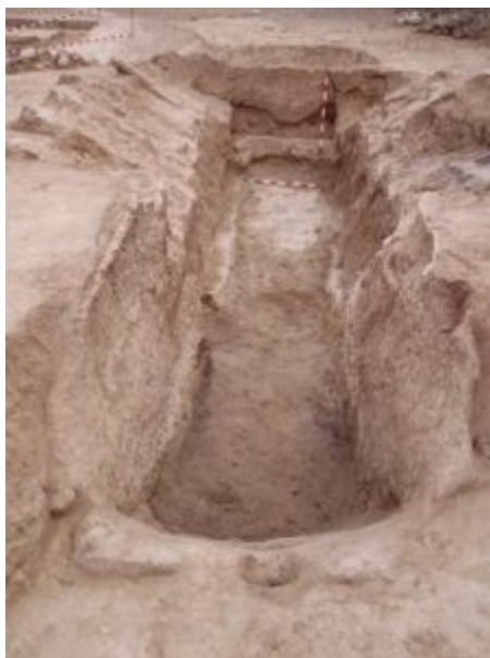
Fig. 4 Horno III (Casabán Banaclocha et alii 2013: 68, fig.3).