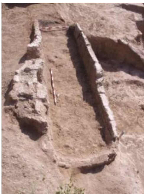
Fig. 2 Horno I (Casabán Banaclocha et alii 2013: 66, fig.1).