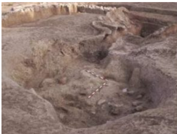
Fig. 5 Horno IV (Casabán Banaclocha et alii 2013: 69, fig.4).