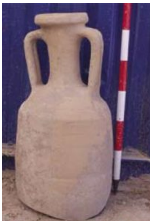
Fig. 8 Dressel 2-4 de producción local (Casabán Banaclocha et alii 2013: 72, fig.9.2).

En las publicaciones consultadas no aparecen dibujos arqueológicos del material, si bien por las fotografías mostradas, parecen seguir, en líneas generales, las características morfológicas de las producciones del Ager de Dianium , como las producciones de l'Almadrava.