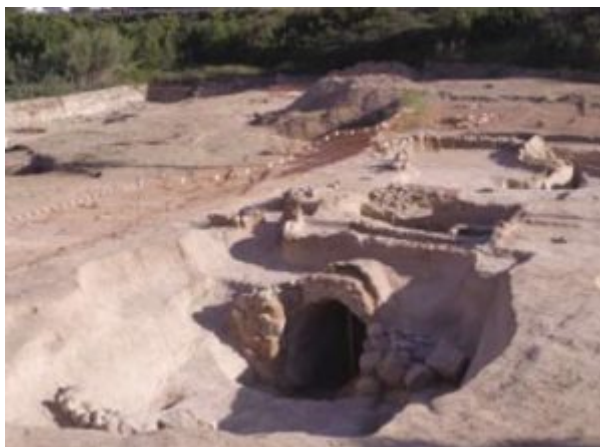
Fig. 3 Horno II (Casabán Banaclocha et alii 2013: 67, fig.2).