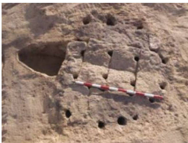
Fig. 6 Horno VI (Casabán Banaclocha et alii 2013: 69, fig.6).