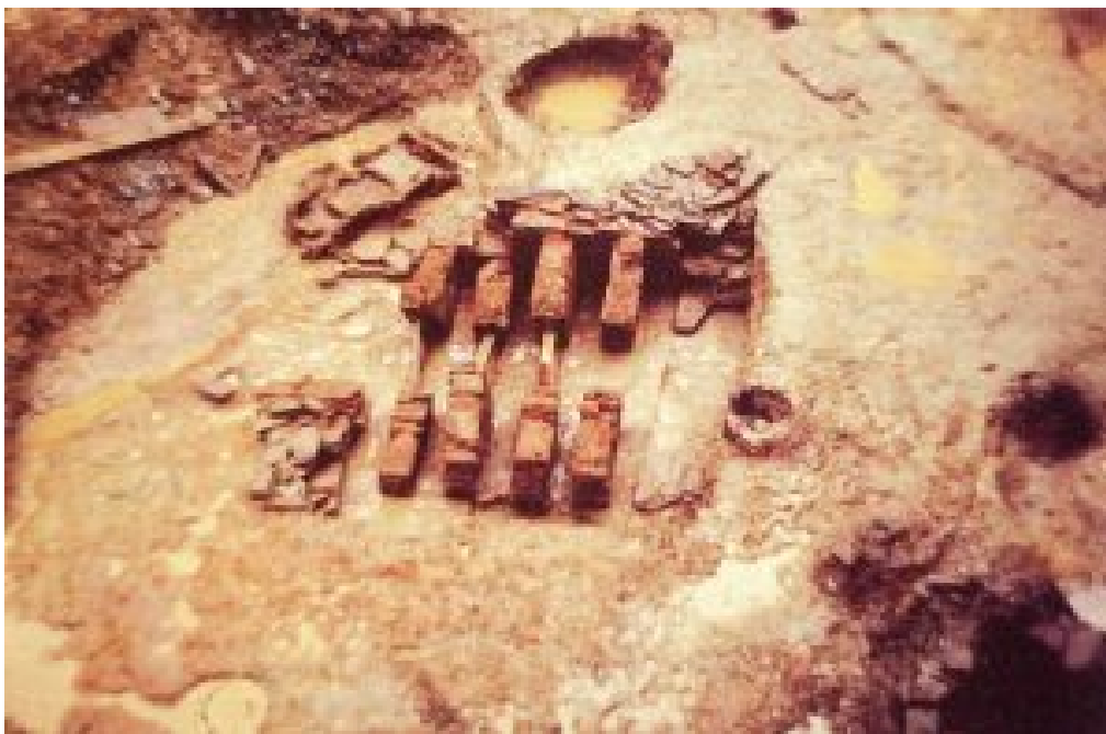
Figura 2. Hornos 1 (derecha) y 2 (izquierda) de Pazo de San Marcos (Luaces y Toscano 1991a).

Se trata de un horno de pequeñas dimensiones de 1,85 m por 1,10 m, con forma ligeramente absidial y asimétrico, sin una diferenciación clara entre la cámara de calor y el praefurnium . El paramiento estaba trabajado con una masa de arcilla endurecida. Disponía de dos ladrillos u una serie de entrantes enfrentados que se correspondería con los encajes de una serie de pilares de ladrillo que sustentarían la parrilla. La boca se orientaba al Noroeste (Alcorta 2001: 429; Luaces y Toscano 1991a: 199, Carrera et al. 1989).