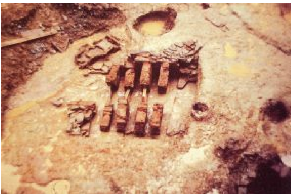
Figura 2. Hornos 1 (derecha) y 2 (izquierda) de Pazo de San Marcos (Luaces y Toscano 1991a).

Se trata de un horno de pequeñas dimensiones de 1,85 m por 1,10 m, con forma ligeramente absidial y asimétrico, sin una diferenciación clara entre la cámara de calor y el praefurnium . El paramiento estaba trabajado con una masa de arcilla endurecida. Disponía de dos ladrillos u una serie de entrantes enfrentados que se correspondería con los encajes de una serie de pilares de ladrillo que sustentarían la parrilla. La boca se orientaba al Noroeste (Alcorta 2001: 429; Luaces y Toscano 1991a: 199, Carrera et al. 1989).