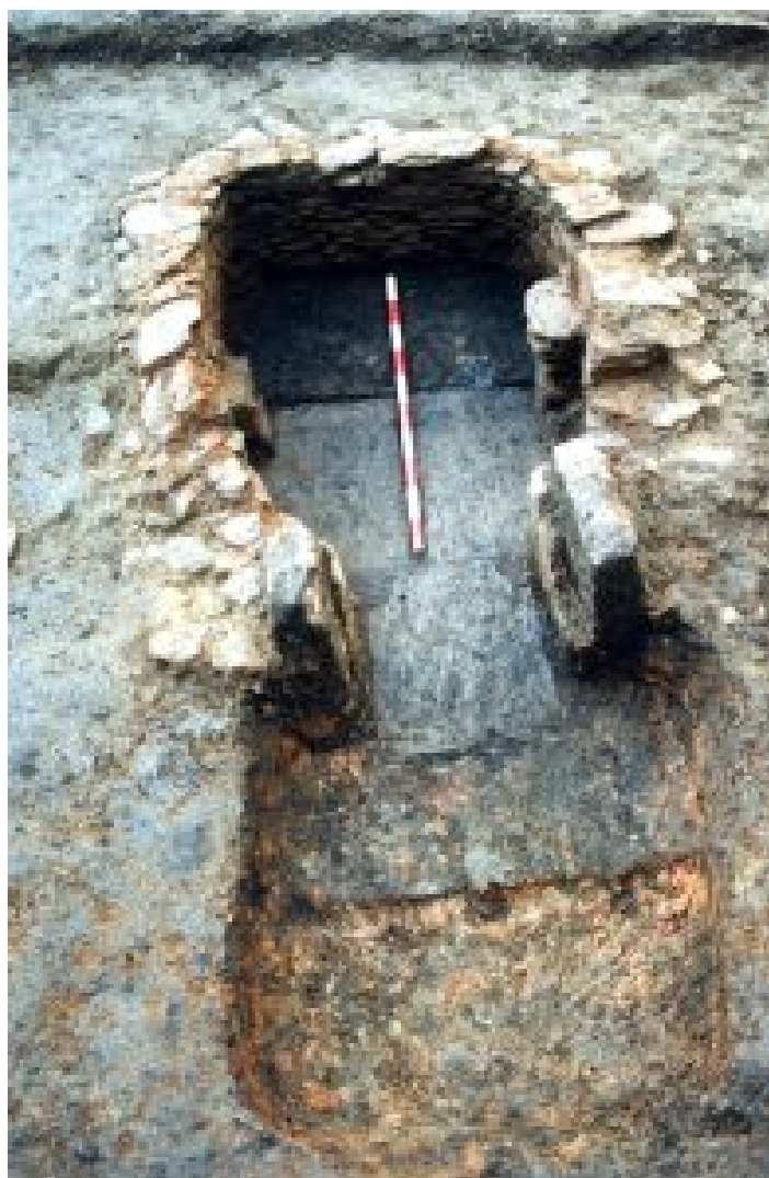
Figura 5. Horno 2 (Enrique González Fernández).