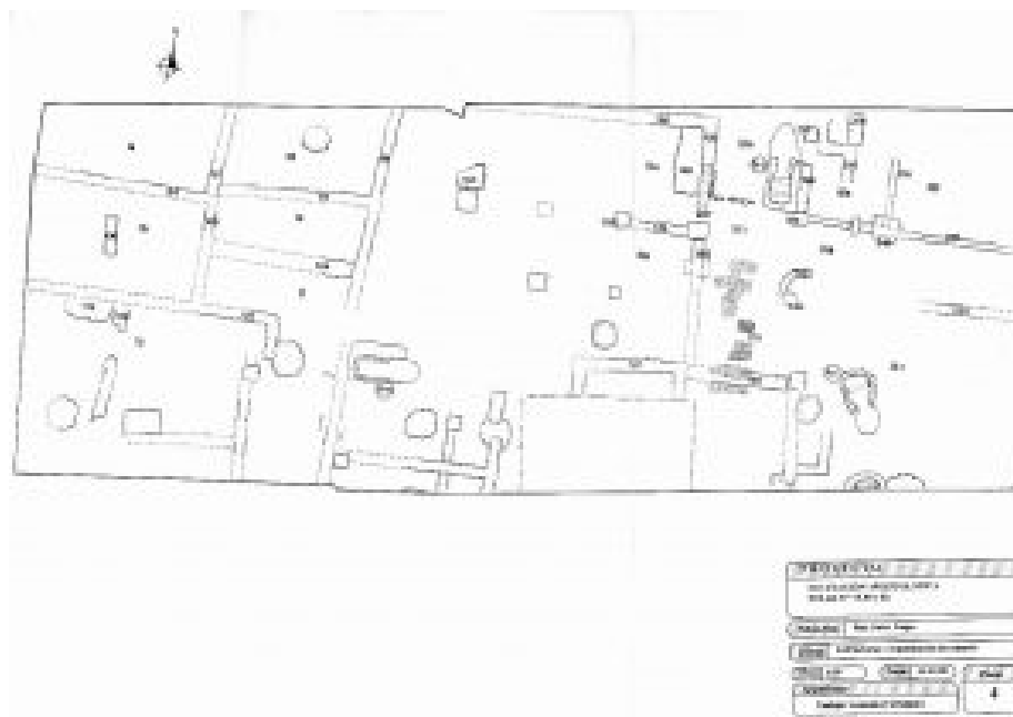
Figura 3. Plano de la intervención Rúa Nova n° 78-82 (Enrique González Fernández).

La localización del complejo alfarero de Rúa Nova Este, así como el funcionamiento y producción del conjunto, debe de relacionarse con los criterios valorados para su instalación. Además de la legislación vigente que regulaba el establecimiento de complejos artesanales en áreas urbanas, se tendrían en cuenta las características urbanísticas y topográficas de la urbe, así como la proximidad a áreas de abastecimiento de materias primas. La localización de la Lucus Augusti en un espolón aplanado en la confluencia de los cursos de los ríos Miño y su afluente el Rato permitiría el aprovechamiento de los recursos hídricos, así como el abastecimiento a través de otros medios como pozos, cisternas o fuentes públicas. Uno de los elementos esenciales para el abastecimiento de agua en la urbe fue el acueducto, el cual canalizaba el agua procedente de los manantiales de Agro do Castiñeiro hasta un posible castellum aquae (asociado a la piscina descubierta en 1987 en el solar de la Plaza de Santo Domingo), a partir del cual partiría la red de distribución urbana (Álvarez, Carreño y González 2003; González 2008). En cuanto al abastecimiento de arcillas, a pesar de que pudieron explotarse barreras en las proximidades, debe de destacarse la presencia de diversas fosas para la explotación de este material en las proximidades de los hornos. Al mismo tiempo, el