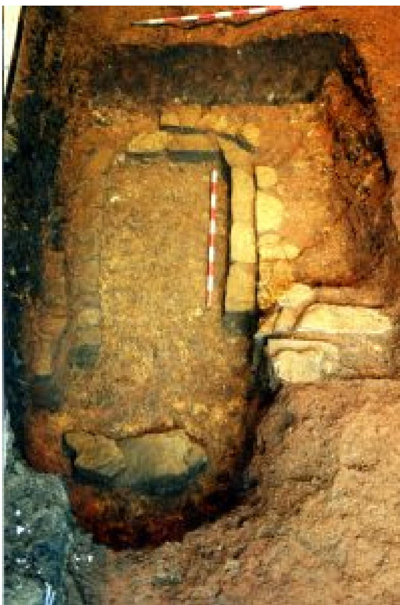
Figura 7. Horno 4 (Enrique González Fernández).

con una altura de 0,35 m y un ancho de 0,90 m. El área de servicio al praefurnium se corresponde con un estrecho plano inclinado de 0,80 por 1 m. La cámara de combustión presentaba planta rectangular. Este contaba con unas medidas internas de 1 m (eje N-S) por 1,50 (eje E-O) y conservaba una pequeña banqueta corrida, que serviría para sustentar la parrilla (González 2000c: 9).