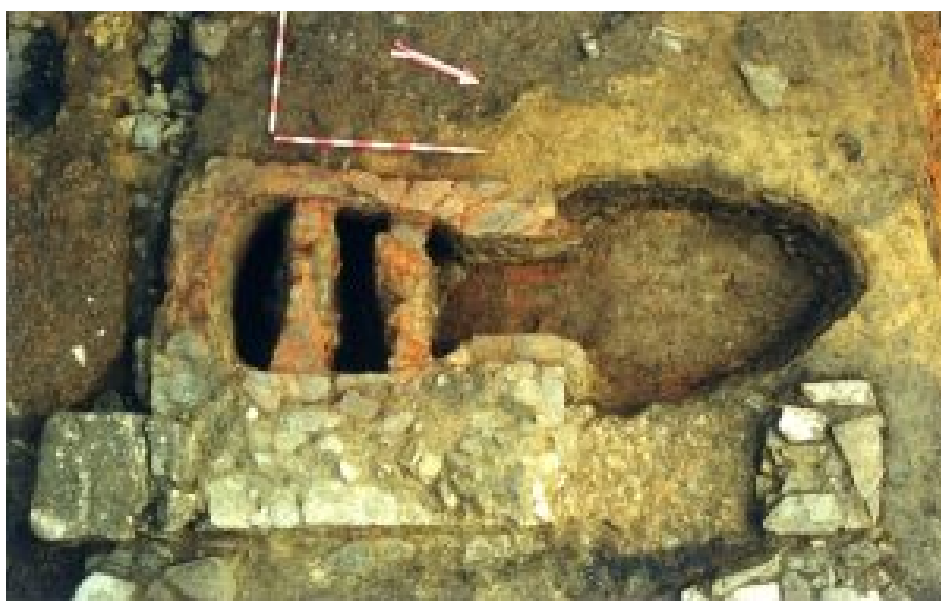
Figura 6. Horno 3 (Enrique González Fernández).

La cámara de combustión, de planta elíptica, presentaba unas dimensiones de 1,20 m metros (eje N-S) por 0,90/0,80 m (eje E-O), La cubierta fue solucionada mediante arcadas, conservadas in situ. El suelo de la cámara estaba constituido por el mismo zócalo de jabre, ligeramente regularizado por una fina capa arcillosa (González 2000c: 9).