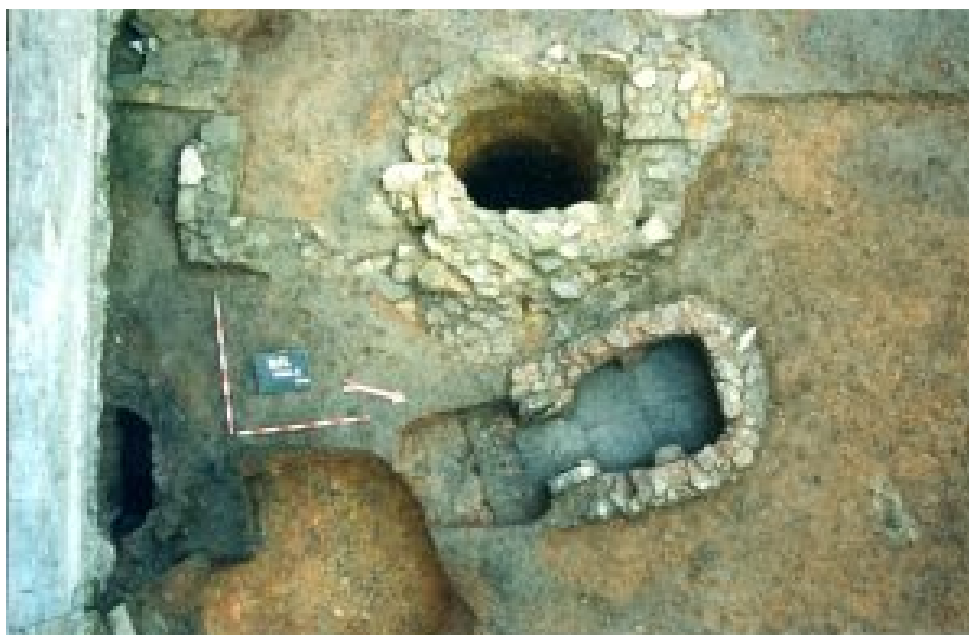
Figura 4. Horno 1 y pozo (Enrique González Fernández).

Durante las intervenciones arqueológicas dirigidas por Enrique González Fernández en los solares 76-82 de Rúa Nova se exhumó, en las proximidades del Horno 1, un pozo (González 2000a: 6).