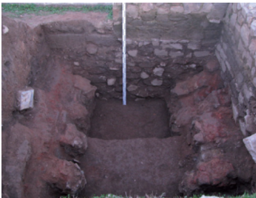
Fig. 1 Detalle del horno documentado en 2006 (extraído de Puerta López y García Rosselló 2014: 192, fig.2).