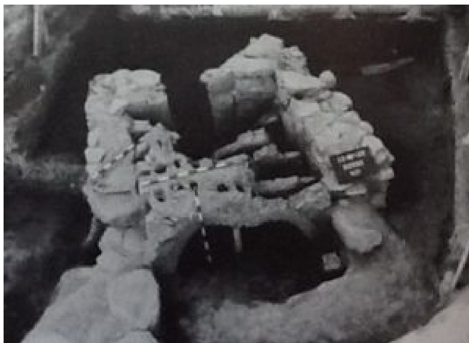
Figura 3. Imagen de los restos conservados del horno de San Roque (Imagen de Covadonga Carreño Gascón y Enrique González Fernández 1995).